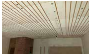
Deckenheizung im Wohnraum